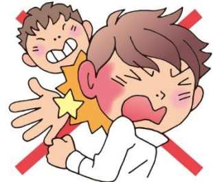
みみ 耳のそばをたたかない