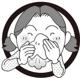
かたほう お ほな 片方ずつ押さえて鼻をかむ