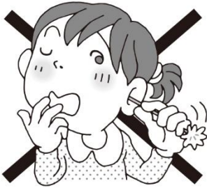
みみ ちゅうい 耳そうじのやりすぎに注意

ふだん つぎ てん き つ みみ たいせつ こうどう 普段から次の点に気を付けて、耳を大切にしたら行動をしていきましょう。