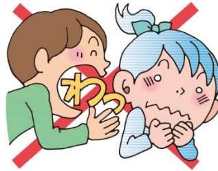
みみ ちか おお こえ だ 耳の近くで大きな声を出さない