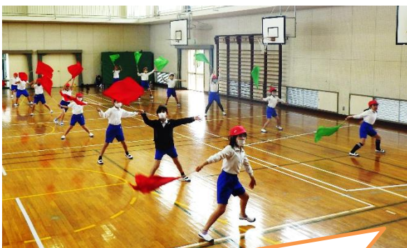
屋休みも4年生が手本となって、練習しています。