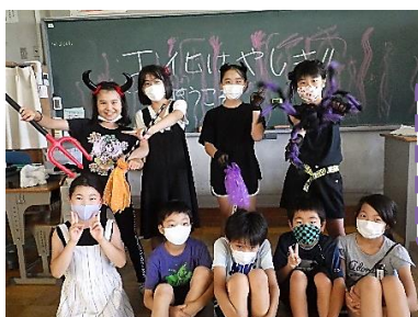
7月19日 お楽しみ会 の様子

給食費5,000円+学年費1,500円+積立金1,500円+手数料10円=8,010円