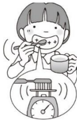
かる ちから 軽い力で シャカシャカと みがく