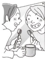
かがみ み 鏡を見ながら みがく