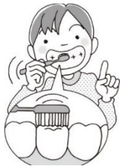
ほん 1本ずつみがく