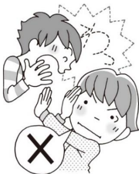
みみもと おお こえ だ 耳元で大きな声を出さない