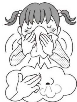
はな かたほう お 鼻をかむときは片方ずつ押さえる